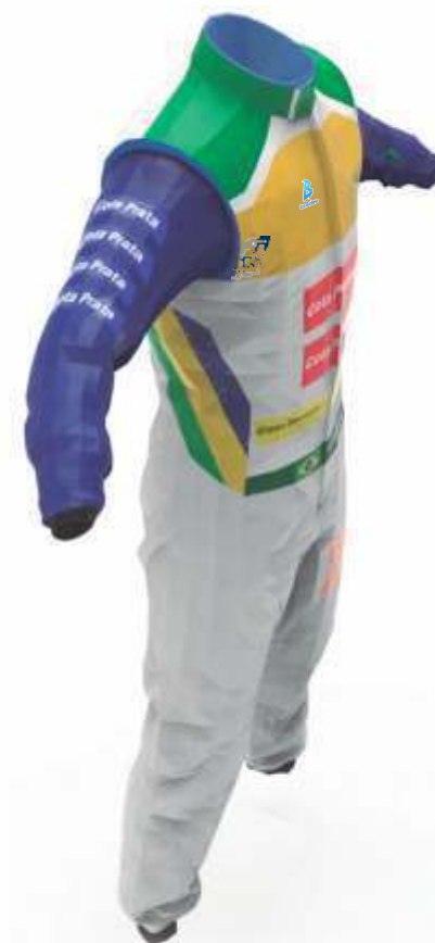
TRAJE DO PILOTO